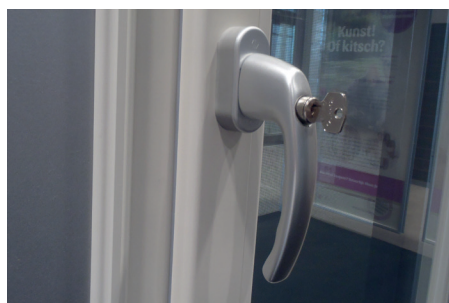
Ontgrendel de kruk met de sleutel

De draaikiepramen zijn voorzien van een meerpuntssluiting. Hieronder ziet u afbeeldingen hoe u het draaikiepraam kunt bedienen: