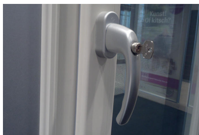
Ontgrendel de kruk met de sleutel

De draaikiepramen zijn voorzien van een meerpuntssluiting. Hieronder ziet u afbeeldingen hoe u het draaikiepraam kunt bedienen: